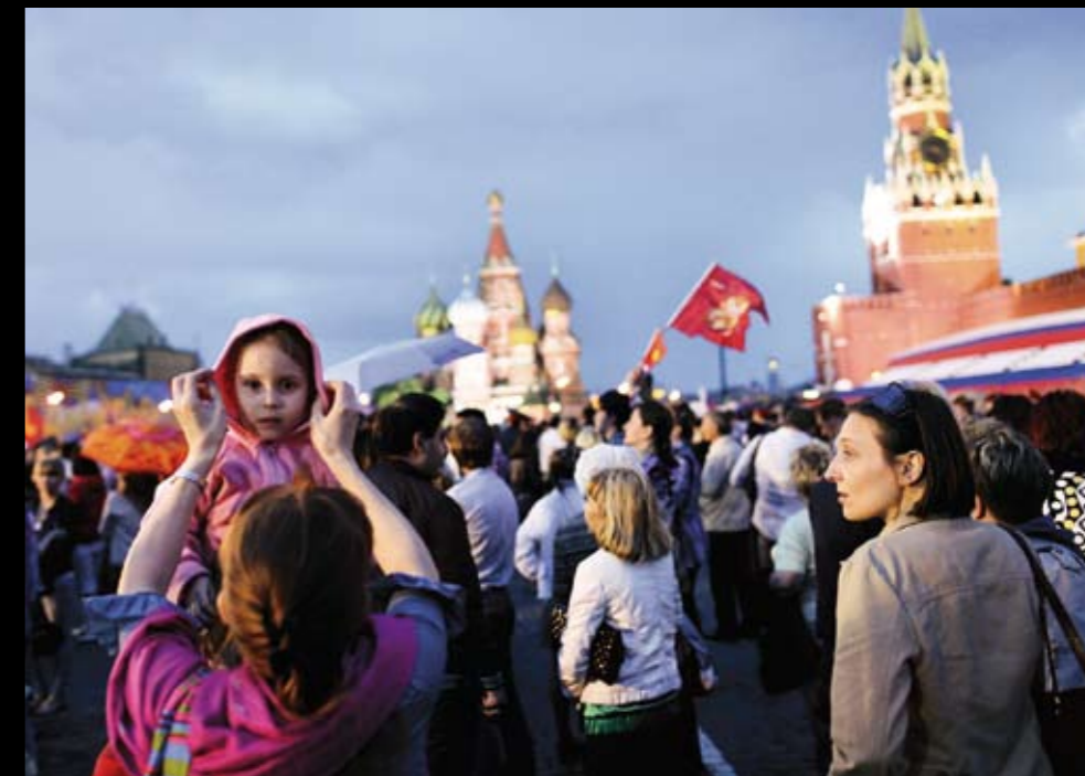
Po průtrži mračen lidí na Rudém náměstí neubýlo, ale přibýlo

VIP RUSOVÉ UŽ SPALI, KDYŽ JEJICH NÁROD SLAVIL PĚTAŠEDESÁTÉ VÝROČÍ VYHRANÉ VÁLKY