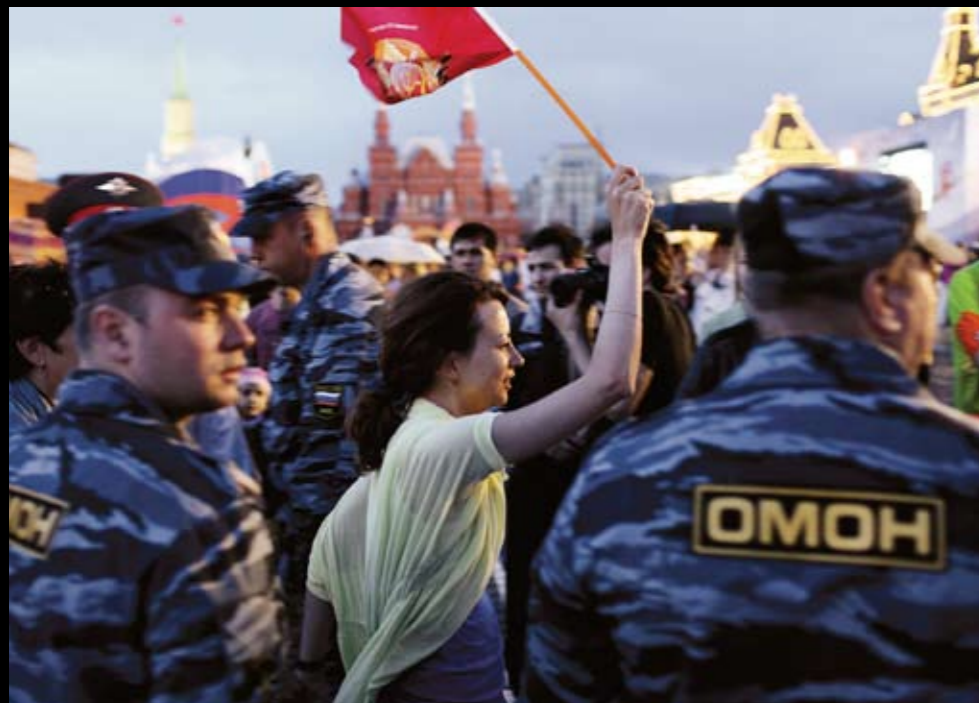
Členové Oddílu milice zvláštního určení (OMON) postávali jako většina lidí na Rudém náměstí