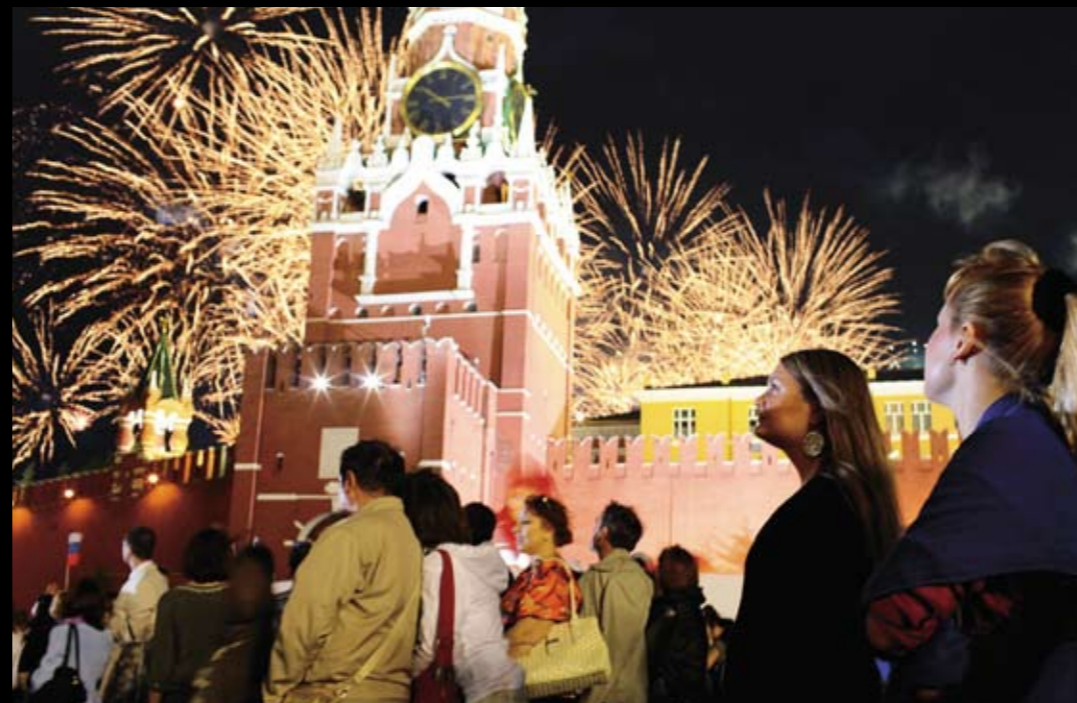
Ohňostroji, který ukončil oficiální oslavy, začal přesně v deset hodin večer moskevského času