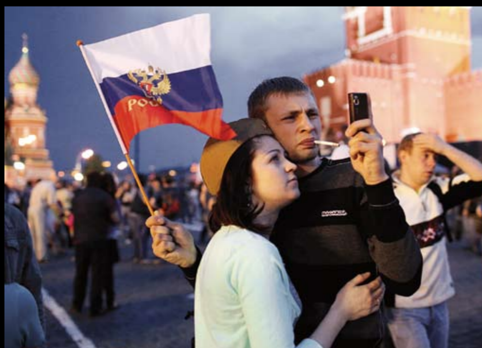
Ne Japonci, ale Rusové milují fotografování. Tihle milenci s vlajkou a chrámem Vasila Blaženého.

Ještě letošní rudý večírek poslal světu nějaký vzkaz, pak ten, že obyčejní Rusové znovu objevují poztráčené velmocenské sebevědomí. Možná že se Boris Jelcin v devadesátých letech zmýlil, když odstoupil od pořádání okázalých vojenských přehlídek jako deklarace konce studené války. Možná že jeho nástupce Vladimír Putin, který znovu obnovil obří demonstrace národní sounáležitosti a výstavky plechové pěsti, porozuměl svým Rusům přece jen lépe. A také jeho Rusové mu proto dodnes dobře rozumějí. ✕