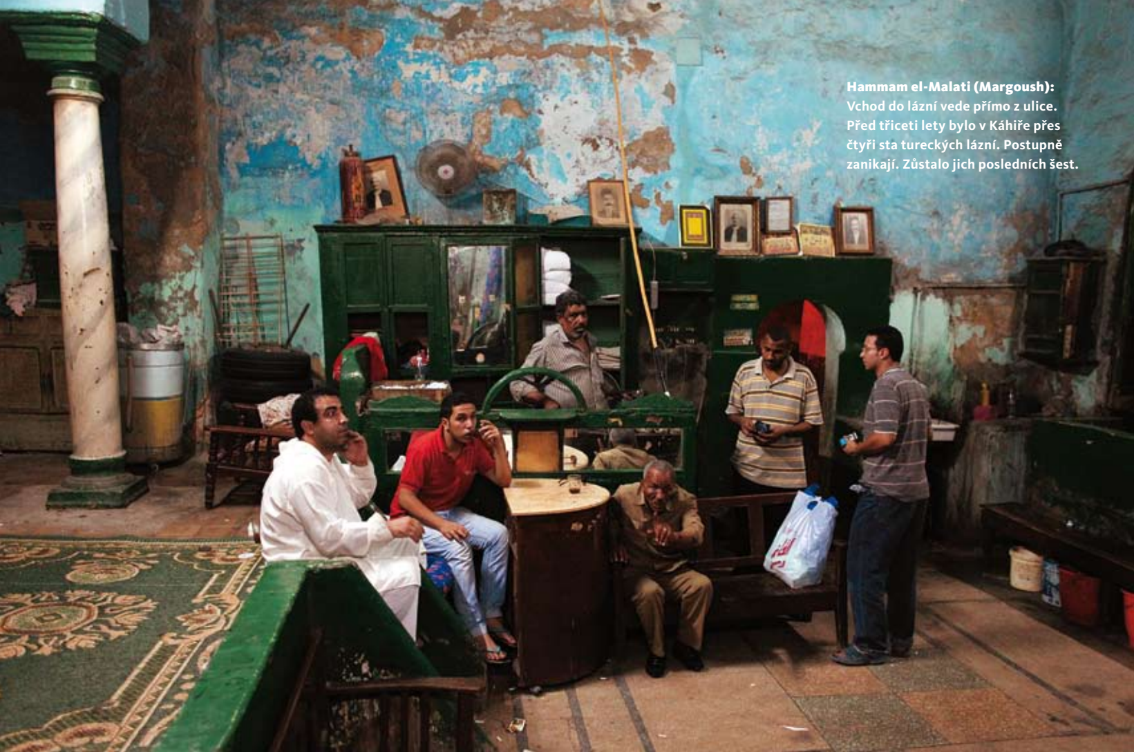
Hammam el-Malati (Margoush): Vchod do lázní vede přímo z ulice. Před třiceti lety bylo v Káhiře přes čtyři sta tureckých lázní. Postupně zanikají. Zůstalo jich posledních šest.