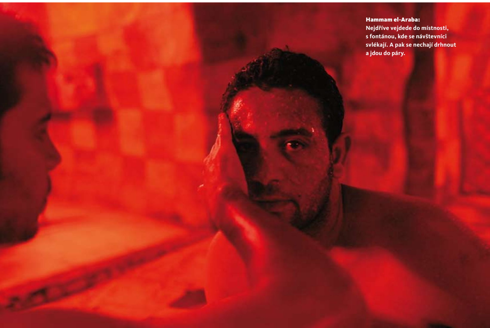
Hammam el-Araba: Nejdříve vejde do místnosti, s fontánou, kde se návštěvníci svlékají. A pak se nechají drhnout a jdou do páry.