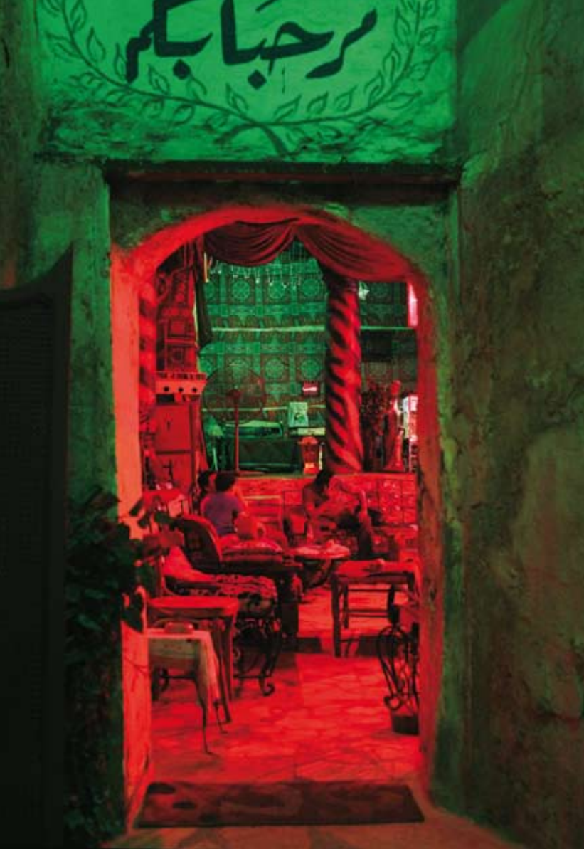
Hammam el-Araba: lázně zdobí diskosvětla, akvarijní rybičky a vánoční řetězy

Cizinci sem po setmění nepřijdou. Ne že by tu hrozilo nějaké nebezpečí, ale ztichlé a vyprázdněné město je najednou cizí a nepochopitelné, přestalo být turistickou atrakcí.